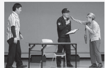
◆わかりやすく楽しい寸劇。