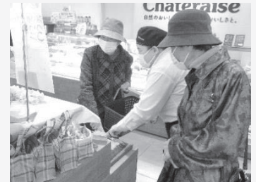
◆洋菓子店 シャトレーゼ