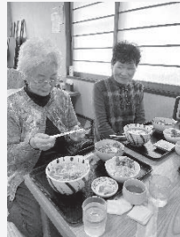
◆昼食時、話も弾みます。