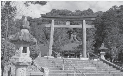
◆石見一宮 物部神社