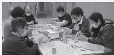
◆ランプシェードづくり サロンでやってみたい声続出。